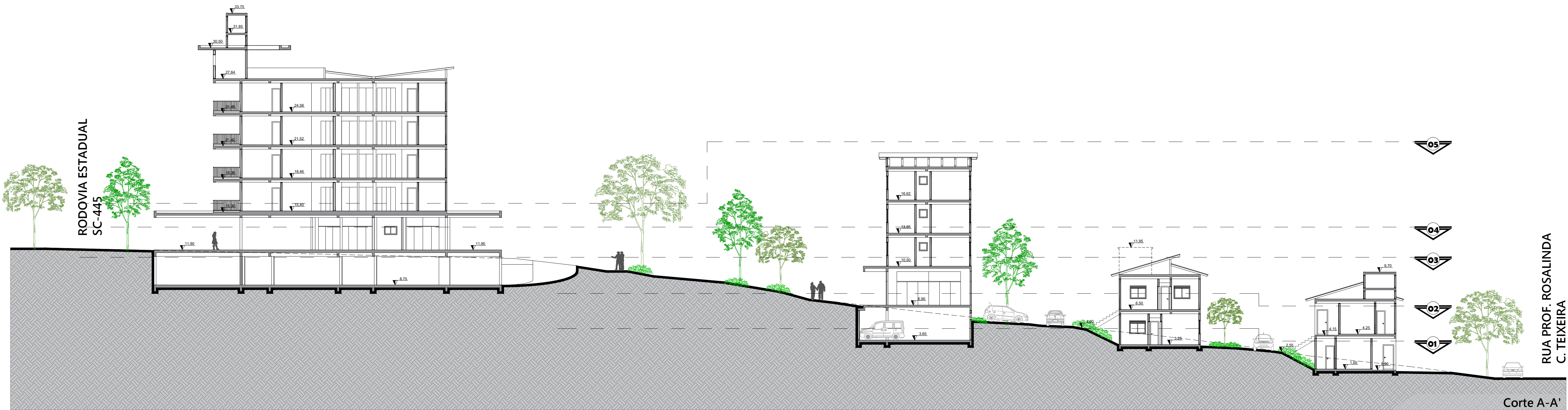
Corte A-A' Esc.: 1/200