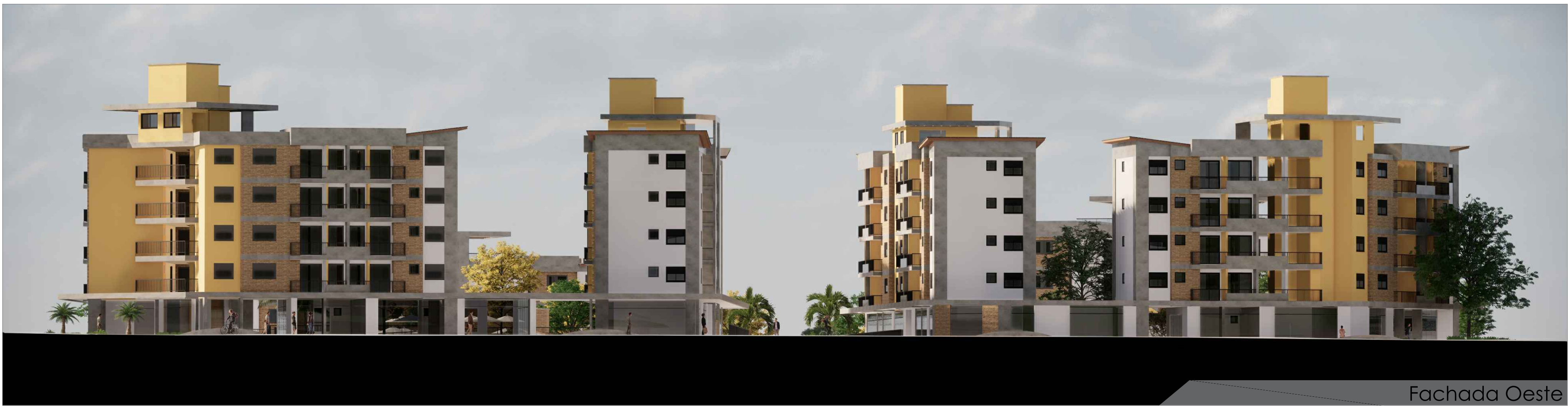
Fachada Oeste S/Esc.