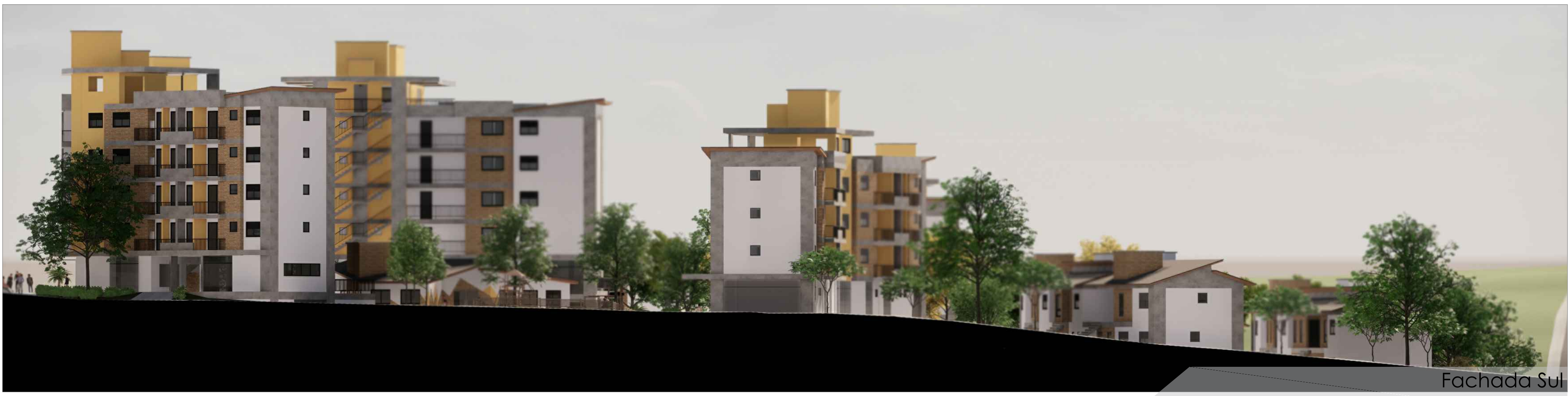
Fachada Sul S/Esc.