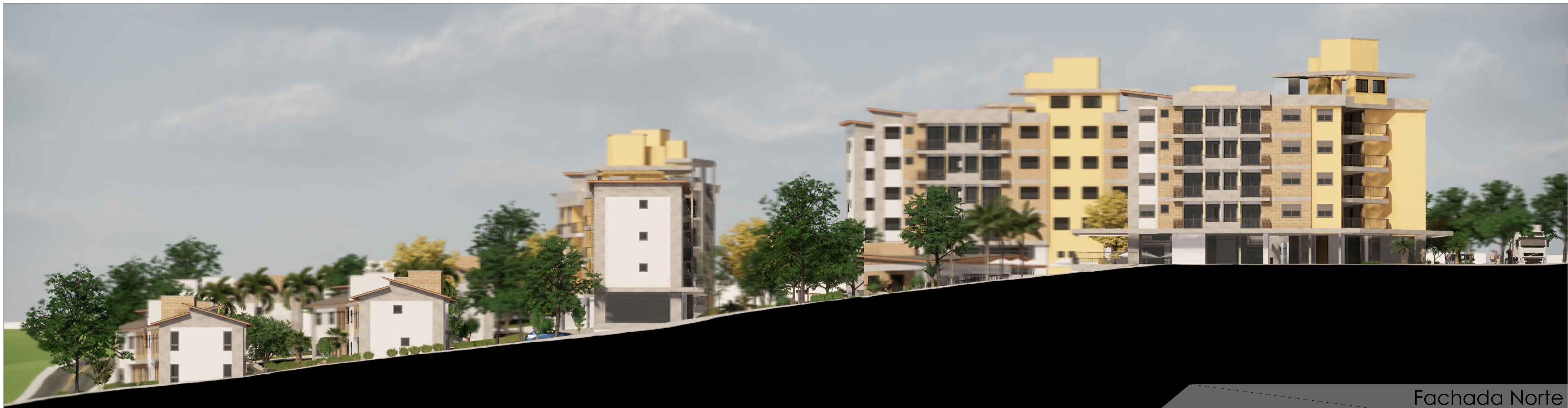
Fachada Norte S/Esc.