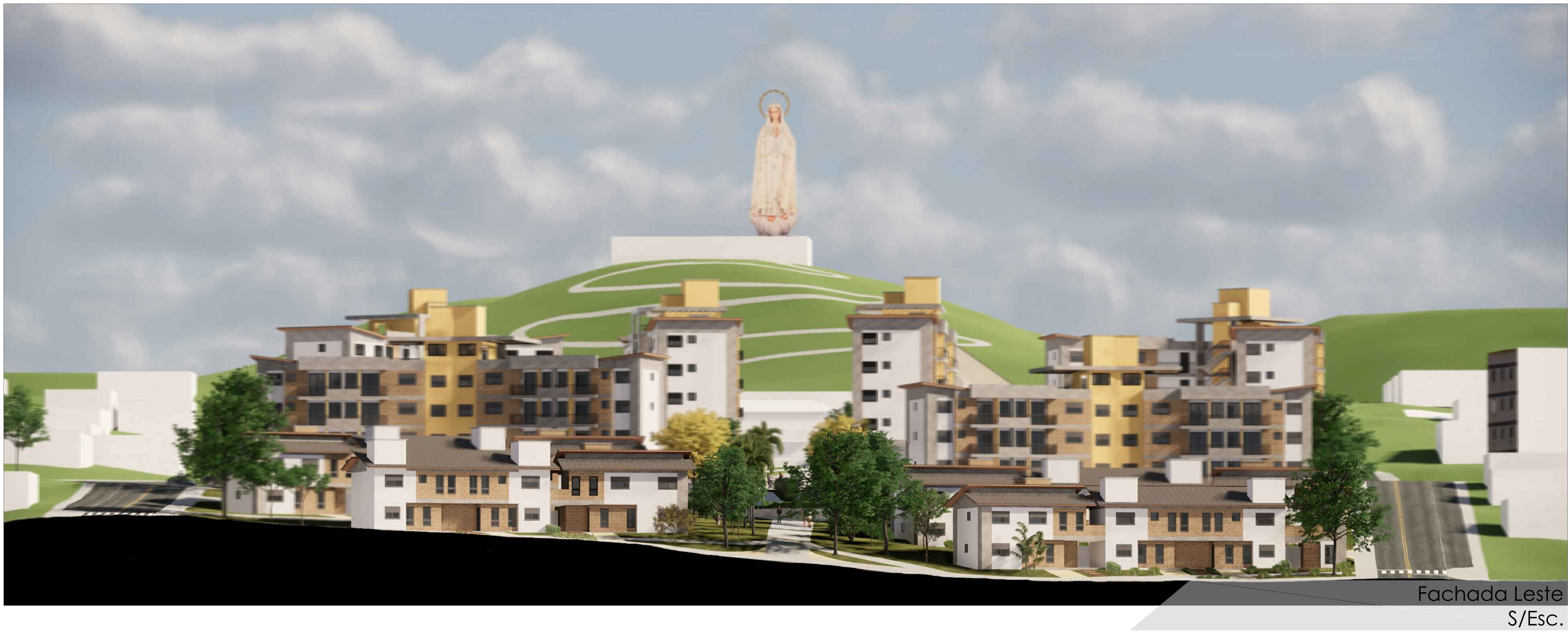
Fachada Leste S/Esc.

OBJETIVO GERAL: Propor um Anteprojeto Arquitetônico de um conjunto de Habitação Social, à partir de um embasamento teórico e das diversas escalas de estudo urbano para o Bairro Vila São Jorge, Município de Siderópolis- SC